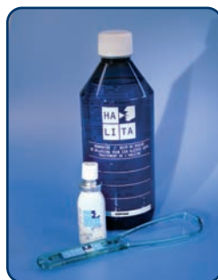
Gorgelmiddel, mondspray en tongreiniger

Reinig uw tong met een tongreiniger. Schraap in ongeveer vijf keer de bacteriën en het slijm van uw tong af. Hoe verder u achter op uw tong komt, hoe meer u kunt weghalen. Reinig uw tong twee keer per dag, het liefst 's ochtends en 's avonds. Onderzoek toont aan dat het reinigen van de tong met een tongreiniger effectiever is dan met een tandenborstel. Levert het tongreinigen onvoldoende resultaat op? Dan is een intensievere verzorging nodig. Soms moet u naast het tongreinigen de bacteriën die uw slechte adem veroorzaken, doden met gorgelmiddelen en/of een mondspray (Halita). Tongreinigers en sprays zijn zonder recept bij uw apotheek verkrijgbaar. Overleg met uw tandarts of mondhygiënist hoe vaak u de tongreiniger of de andere middelen kunt gebruiken.